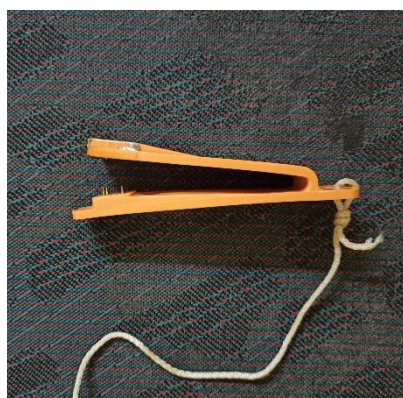
Призма и компостер